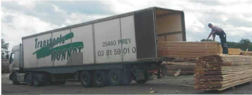
Погрузка товара в другие регионы

База "Интерстрой" - ул. Мостовая 14, стр. 1, тел. 22-53-51 Филиал №1 - ул. Мостостроителей (2 лесозавод), тел. 44-13-23 Филиал №2 - г. Северодвинск, Архангельское шоссе 27, тел. 44-33-00