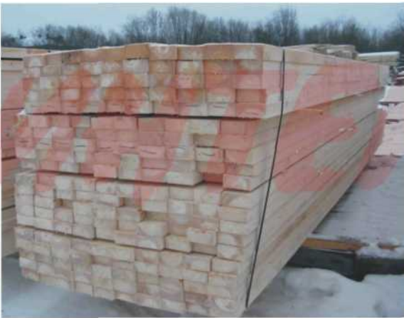
ГРУППА КОМПАНИЙ Пиломатериалы