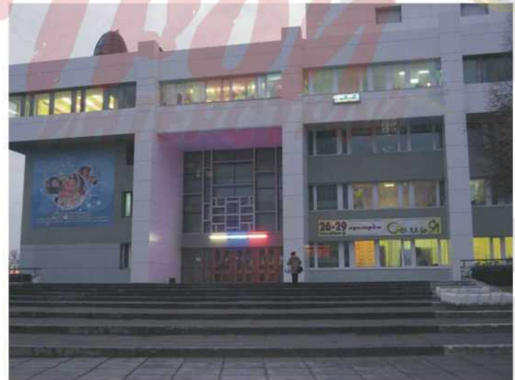
Дворец пионеров г. Архангельск