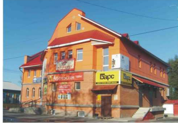
Торговый центр. г. Каргополь