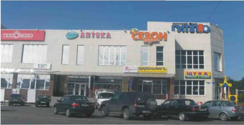
Торговый центр "Гиппо", ул. Тимме