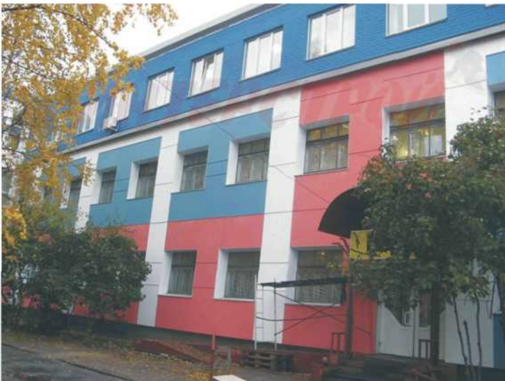
Офис-магазин "Барс", Обводный канал